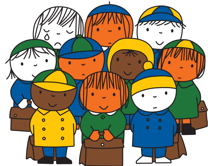
illustratie Dick Bruna © copyright Mercis bv, 1966